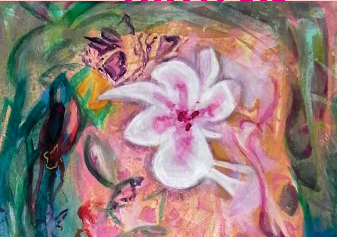
"Florales" (Ausschnitt) Christine Pflug www-christine-pflug.de/galerie/de